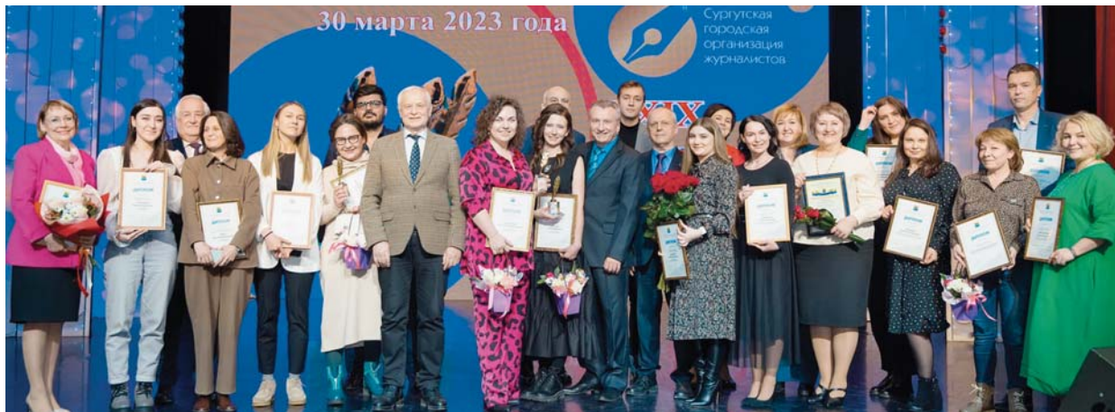
Церемония награждения победителей конкурса

Легенды сургутской журналистики стояли у руля самой крупной общественной журналистской организации севера Западной Сибири. Они подняли её