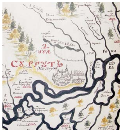
Чертёжная карта Сургута, 1701 год, Ремезов

ученый, этнограф, фольклорист Кустаа Карьялайнен в своих путевых заметках, опубликованных в периодическом сборнике «Сибирские вопросы», отмечает: «... Сургут восстал из пепла и достиг если не процветания, то некоторого благосостояния. Наружный вид свидетельствует уже об этом. Хорошо, по-сибирскому понятию, построенные дома расположены в виде широких, хотя неблагоустроенных улиц. Улицы летом не кажутся неопрятными, потому что большую часть их покрывает зелёный покров, а за чертою города пасётся домашний скот. Большая часть домов маленькие, но встречаются совершенно городские. А если попасть в дом сургутского богача, то и не подумаешь, что находишься в Сибири: изящные гардины, мягкие ковры, блестящая мебель, золочёные висячие и столовые лампы, подсвечники и бра; великолепные комнатные растения напоминают страну, «wo die Citronen blühen»*. Даже у бедняка стены в гостиной оклеены обоями, передний угол весь занят образами в золочёных и серебряных ризах, по стенам развешаны картины, позволяющие любоваться подвигами Скобелева и Суворова, адскими мучениями, страшным судом, событиями из жития святых в более или менее грубых апокрифических олеографиях. Правда, далеко не во всяком доме стены и пол в достаточной