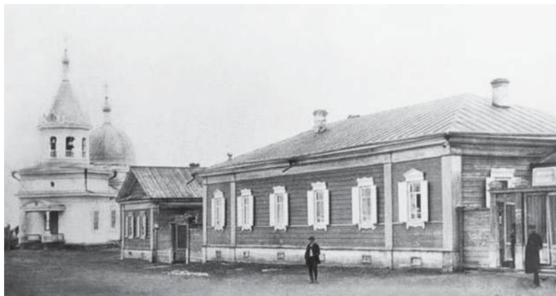
Сургут в начале XX века. Богородицкая улица

что город совершенно ветхий и разваливается».