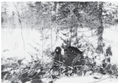
Глухориное токовище в заповедной зоне на Тайлаковском месторождении

На буржуйке, которая топилась дровами, готовили или разогревали пищу (в основном из тушёнки, колбасного фарша, рыбных консервов), кипятили традиционно круто заваренный чай, сдобренный сгущёнкой. Семейные геологи в зимнее время привозили замороженные пельмени.