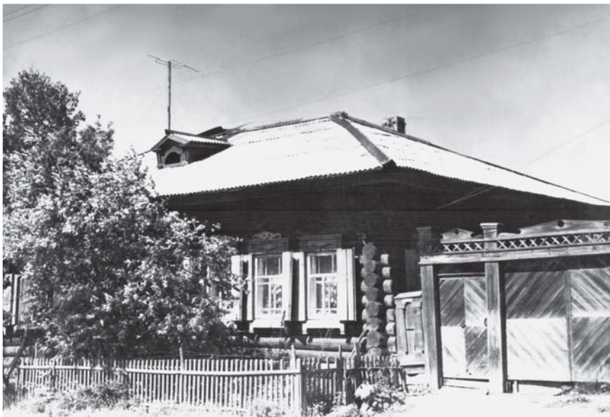
Дом Б.А.Проводникова на ул. Зырянова, 7

Улицы с большими ухабами и непроходимой грязью появились в Сургуте с приходом геологов и