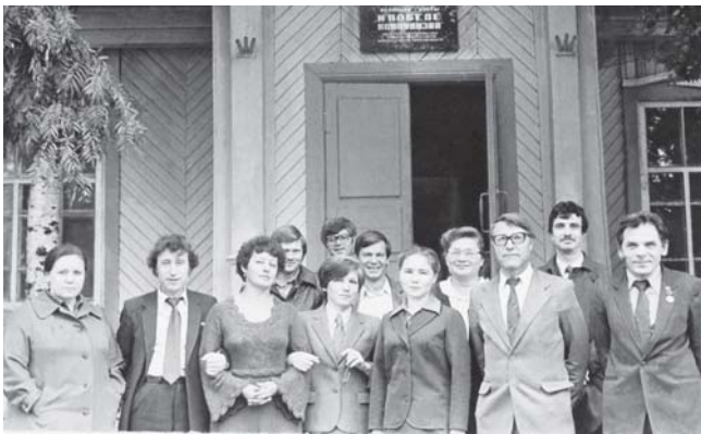
Коллектив газеты «К победе коммунизма» у здания редакции, 1980–1990-е гг.