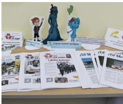
Выставка газеты «Дом на воде», Тобольск, 2021 г.

Дело, которым живёт буквально вся школа, было неоднократно признано на всех уровнях: от районного до всероссийского. Школьная газета получала грант на развитие во Всероссийском конкурсе «Культурная мозаика малых городов и сёл: партнёрская сеть». Аудиторы, которые контролировали освоение бюджетных денег, удивлялись: «Никогда бы не подумали, что в таком небольшом поселении можно научить детей так любить трудиться». Не верили они и в то, что такую газету от начала и до самой последней точки пишут дети. Но увидели и поверили.