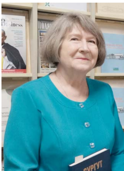
Г. Библия, 2024 г.