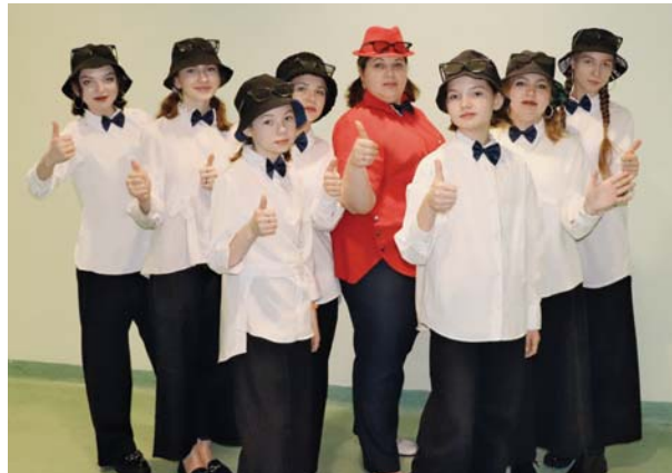
На межрегиональном фестивале «Огни тайги», Стрежевой, 2022 г.