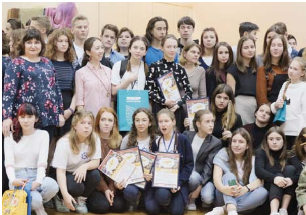
Победители конкурса «Золотое пёрышко», Тобольск, 2021 г.

«Ляминская СОШка» за семь лет превратилась в «Дом на воде». Новый виток в развитии эколого-краеведческой газеты произошёл тогда, когда в Лямину приехала медиашкола СурГПУ. Нас буквально взяли под крыло, помогли