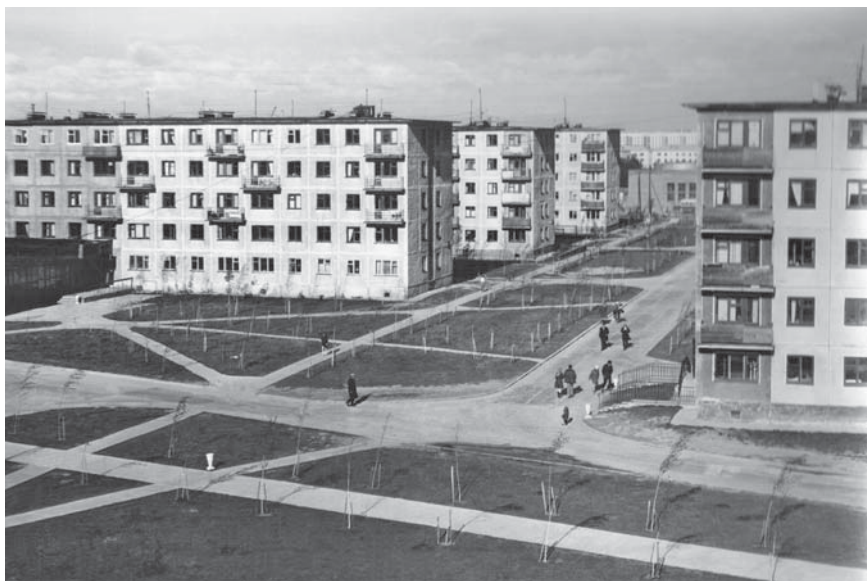
Новые микрорайоны, 1970-е гг.