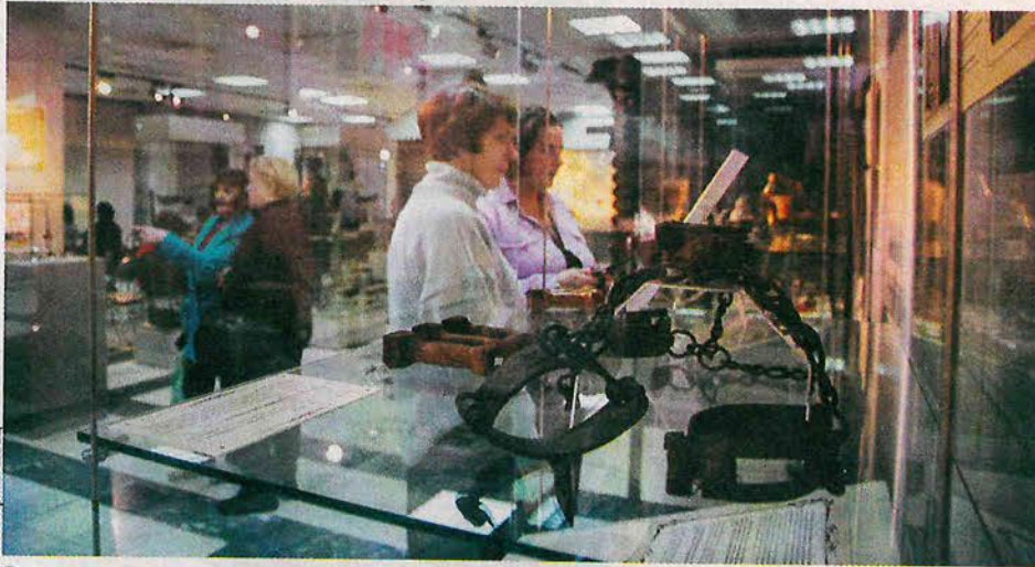
В краеведческом музее пройдет фестиваль, посвященный 430-летней истории Сургута

Куда сходить 8 и 9 июня в Сургуте и Сургутском районе