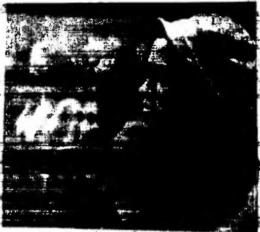
ВНИМАЯ МУЗЫКЕ СТИХОВ.

Апрельский лед, запущенный, бесхозный, Бессонницей вымотал заикоза, И редкий дель зрачкастые просветы Говенной геологоразведки: Лед разорвет постылые объагты — Предвестница ромашковых званятий, Патронами, тушеюющей и борщам Нагривает залубезная баржа. Она пришла нежданно-неждано: С разминистостью звездного бытана. Идв аажившим тоненьких костров Разланы дубы прожекторы! Поселенье марьяращие дойма... И вот четата в забасанном трюме, Где а нам припаав, струдаясь гаметы, Пятипедальной давности газетны И папанаш от разлук и бед — Почтоашия помотавшийся брезент. Из темных педар жышки — салотом! И кто-то арио реанит в полутона: — Эй, слава макронному десанту! — Рокочущее эхо над лесами... Ушла баржа. Повеышена озера. К пустой воде не приулинься взором. И третий дель, как будто гретий год, Холодная порода, из-под нб, Холодные, сырые асчмедки, Холодные забатные аисья — Ну, словом, будни, иголева проза... Лишь сумрачные буркала заикоза, На отор риз в тенетах небосаде — Распуница, неветная погода.